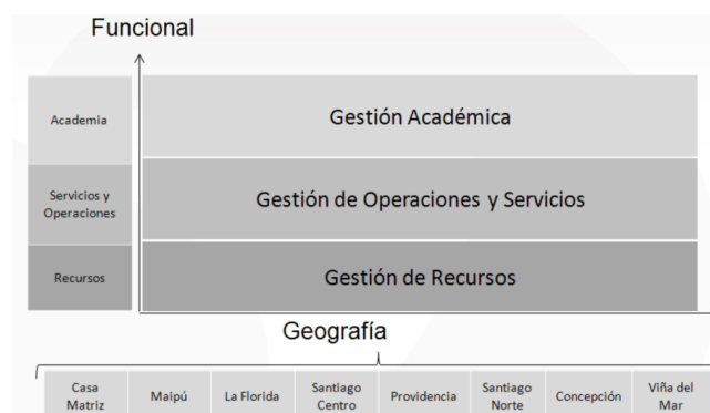
Figura 2: Modelo Matricial Universidad de Las Américas